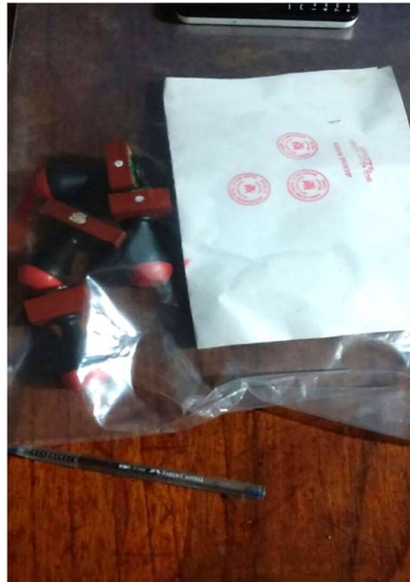
Tramitador de la Organización Criminal encontrado con sellos de la ATFFS – Selva Central